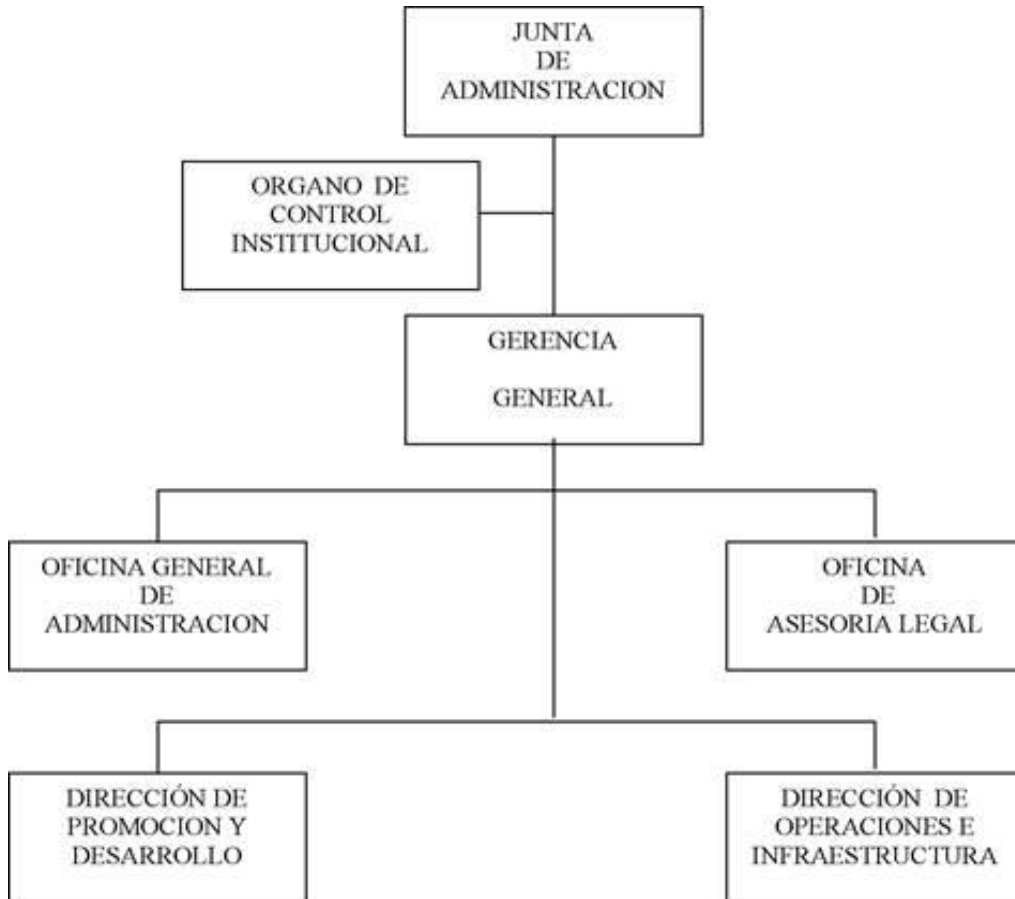
ORGANIGRAMA DE ZED ILO

El Reglamento de Organización y Funciones (ROF) presenta a la Junta de Administración como máximo órgano directriz, y a la Gerencia General con sus respectivos órganos de línea, de apoyo y asesoramiento, como órganos ejecutores.